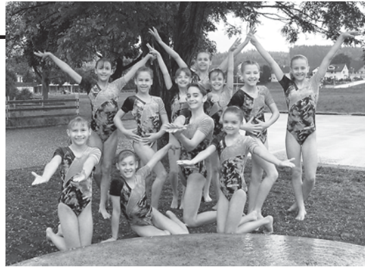
All diese Kunstturnerinnen qualifizierten sich für die Schweizer Juniorinnen-Meisterschaften, bravo!